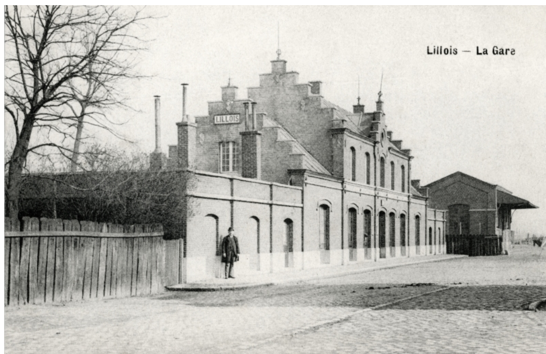
Gare de Lillois